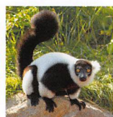
エリマキツネザル